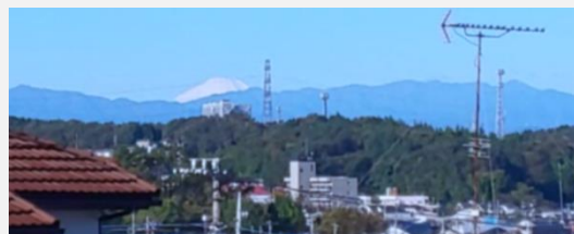
▲カフェ会場のウッドデッキからの景色は絶景。