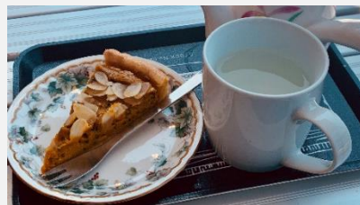
▲かぼちゃのタルト(200円)とカモミールティー(100円)。