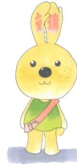
緑区「地域・交流くん」

昨年、緑区内の地域ケアプラザの地域活動交流事業で「地域・交流くん」のキャラクター募集を行い、368通の応募いただきました。ご協力くださったみなさまありがとうございました。その中から、緑区の「地域・交流くん」が決定いたしましたのでご報告いたします。これからいろいろな場面で登場する予定ですので楽しみに!!