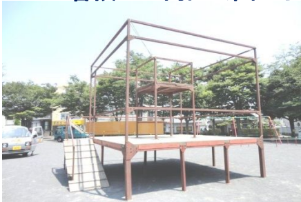
やぐらの骨組みの完成!