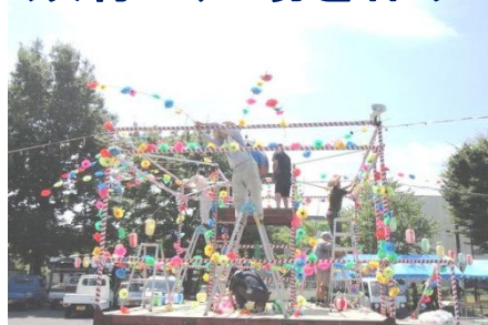
8/2 花やちょうちんの飾りつけて