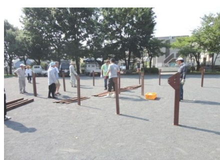
鉄骨で足場を作り