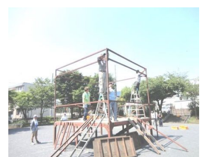
やぐらの上の部分を組み立て