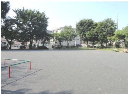
7/26 普段の日向山公園から