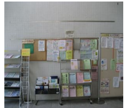
(写真は1階の情報コーナーです)

当施設では、今年度も地域、施設で活動されている団体の活動内容などをご紹介していきたいと考えております。なお、横浜市十日市場地域ケアプラザの1階・2階部分に地域の情報コーナーを設けておりますので、ぜひご覧になってください。